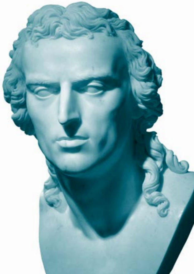
Friedrich Schiller. Büste von Johann Heinrich Dannecker (1758 – 1841)

Freude, schöner Götterfunken, Tochter aus Elysium, Freude, schöner Götterfunken!