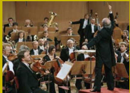
Das Kölner Rundfunk-Sinfonie-Orchester 1986, im Eröffnungsjahr der Kölner Philharmonie, unter seinem damaligen Chefdirigenten Gary Bertini